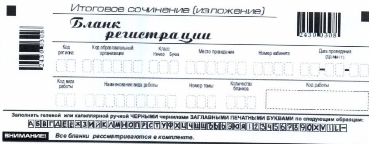
Рис. 2. Верхняя часть бланка регистрации

Поле «код работы» заполняется автоматизированно при печати бланков.